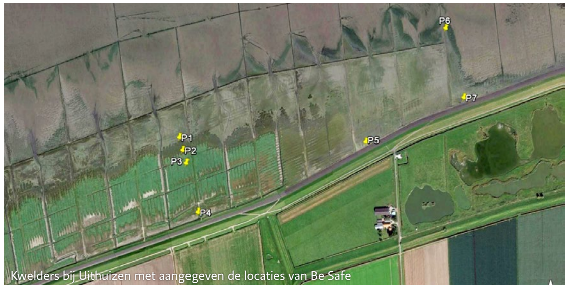
Kwelders bij Uithuizen met aangegeven de locaties van Be Safe

Een hoog en breed voorland of kwelder dempt de golven en vermindert daarmee de belasting op de dijk. Wanneer dit voorland begroeid is en dus ruw, is dit effect nog groter. Dit effect kun je meenemen bij het ontwerp van een dijkversterking. Dit kan de omvang van de versterking verminderen of misschien is versterking dan zelfs helemaal niet meer nodig.