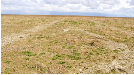
Kwelder na de winter Noord Friesland-buitendijks (stoppelveld), april 2017