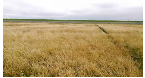
Begroeide kwelder bij Uithuizen, april 2015